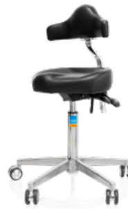
assistPro H Art. Nr.: 2400 0009