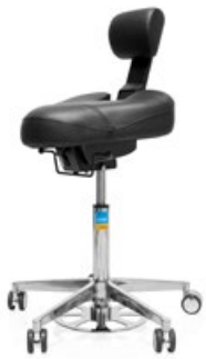
assistTrend Art. Nr.: 2500 0002