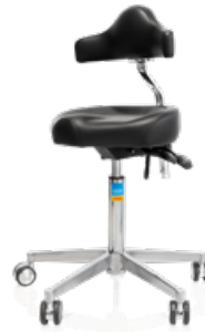
assistPro H Art. Nr.: 2400 0009