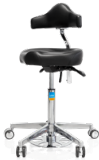
assistPro F Art. Nr.: 2400 0005