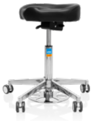
easyPro F Art. Nr.: 2400 0010