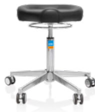
easyPro R Art. Nr.: 2400 0013