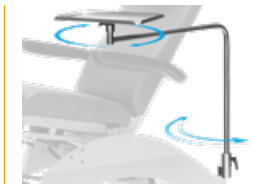
Instrumententisch 300x200x13 mm, schwenkbar, abnehmbar, inkl. Adapter