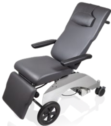
motionLine-E Art. Nr.: 1700 0001