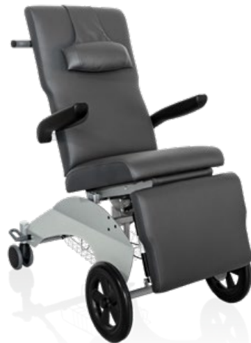
motionLine Art. Nr.: 1700 0000