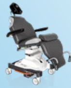
500 XLE comfort