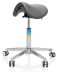
assistLine Art. Nr.: 2400 0015