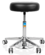
easyLine F Art. Nr.: 2400 0020