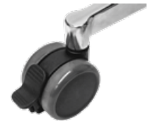
Doppelrolle 65 mm, bremsbar