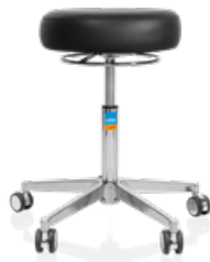
easyLine R Art. Nr.: 2400 0022