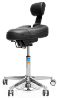
assistTrend Art. Nr.: 2500 0002