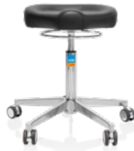
easyPro R Art. Nr.: 2400 0013