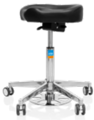
easyPro F Art. Nr.: 2400 0010