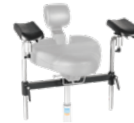
assistTrend Armlehnsatz inkl. Aufnahmetraverse,