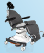
500 XLE comfort