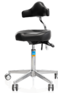
assistPro H Art. Nr.: 2400 0009