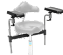
assistPro F Armlehnsatz inkl. Aufnahmetraverse,