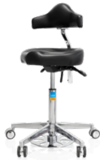
assistPro F Art. Nr.: 2400 0005